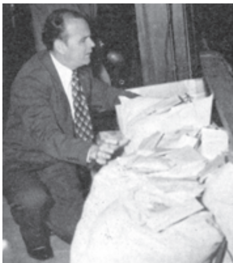
Il Fratello Branham, sotto l'Unzione, prega sui fazzoletti in accordo ad Atti 19:11-12.

Mi ricordo che durante il messaggio mentre ero seduto sul palco guardando le persone e la loro reazione al messaggio di fede che era portato loro, notai una signora che era seduta a circa trenta o quaranta piedi di fronte al palco. Ella stava guardando le sue mani. Si poteva vedere dalle grandi giunture e dall'apparente rigidità delle dita che soffriva d'artrite. Non era in grado di muovere le dita ma quando aveva sentito la Parola di Dio espressa, la sua fede era cresciuta e guardò in basso a quelle dita storpie e cercò di muoverle. In primo momento non ci fu praticamente nessun movimento. Ella continuò ad esercitare la sua fede e quando lo fece divenne evidente che era in grado di muoverle più di prima. Dopo ancora qualche minuto, aprì e chiuse le mani con perfetta facilità. Un sorriso invase il suo volto quando si rese conto che allora era libera dalla condizione storpia che era stata causata dall'artrite.