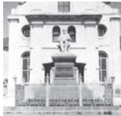
Un monumento in memoria di Andrew Murray, di fronte alla chiesa dove ministrava alla sua gente.

La verità della guarigione Divina trovò terreno fertile nei cuori delle persone del Sudafrica. Questa verità non era nuova per loro. Andrew Murray, uno dei più grandi scrittori sull'argomento della guarigione Divina, era un sudafricano