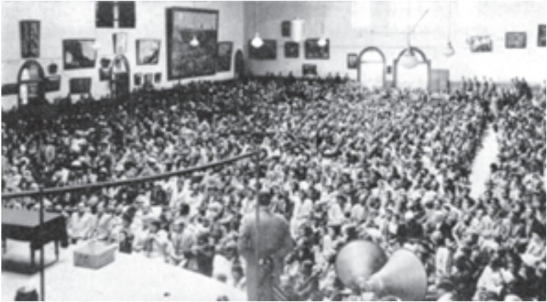
La Sala Drill, Città del Capo, Sudafrica.

Il servizio della domenica mattina, tenuto per i non europei, doveva iniziare alle 10,00, ma le persone iniziarono a radunarsi alle 1,30 di mattina. Sedettero per ore aspettando che il servizio iniziasse. Poi quando le porte furono aperte solo una piccola parte di quelli che si erano radunati all'esterno furono in grado di raggiungere l'interno della sala che conteneva meno di tremila persone. Al servizio del pomeriggio parlai a diversi poliziotti che mi dissero che stimavano che almeno cinquanta persone erano svenute durante il giorno aspettando di raggiungere l'interno della sala.