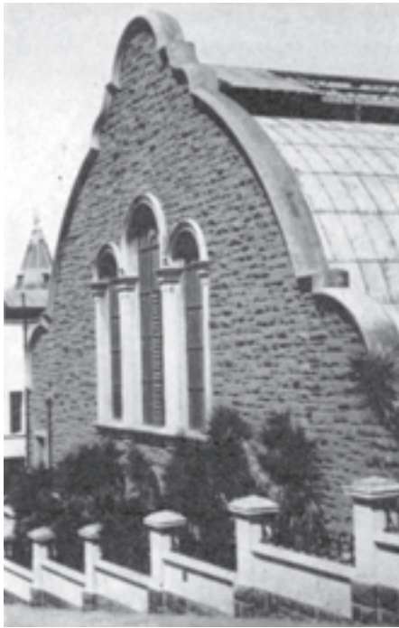
La Sala Feather Market.