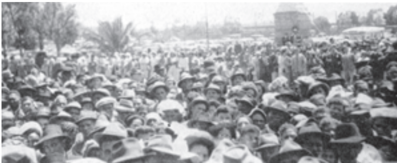
Una piccola parte della folla che non fu in grado di ottenere l'accesso nella Sala Drill.

Dopo il sermone intitolato "Responsabilità e Incoraggiamento" una preghiera di massa fu fatta per tutti quelli che erano nel bisogno della guarigione. Dopo la preghiera chiedemmo testimonianze. Un gran numero venne e diede testimonianza della guarigione che aveva ricevuto. Una ragazza che era stata portata nella Sala aveva una cavaglia rotta che non guariva. Ella ricevette la sua guarigione,