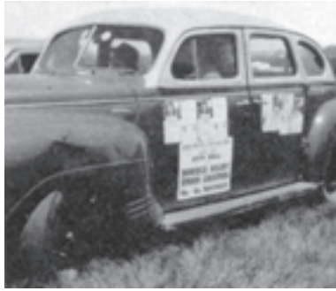
Essa fu utile per fare pubblicità.

delle riserve indigene. Dovunque ci fermammo e parlammo agli indigeni li trovammo essere molto gentili e simpatici. Molti degli indigeni riuscivano a parlare quattro o cinque lingue tribali e non era molto insolito trovare chi riuscisse a parlare inglese. Fummo molto impressionati dal fatto che queste persone sembravano essere sempre felici. Non avevano mai fretta ed erano sempre disposte a darci un sorriso mentre facevamo loro una fotografia. Mai trovammo una persona che esitò a collaborare con noi nel fare una fotografia o nel parlarci delle loro perline, delle varie opere artistiche o del loro tipo di vita.