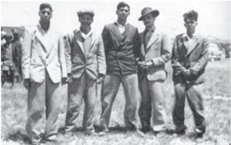
I cinque uomini che il Fratello Branham indicò i quali erano dell'Ospedale d'Isolamento.

Durban è una bella città. L'aria è intensa con il profumo di centinaia di varietà di fiori selvatici e domestici venduti nei mercati di fiori. Ci sono spiagge che sono di fama mondiale. È anche la patria dei ragazzi dei pittoreschi riscì.