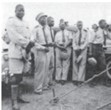
Ufficiali della polizia indigena che direbbero le folle alle riunioni per gli indigeni a Pretoria.