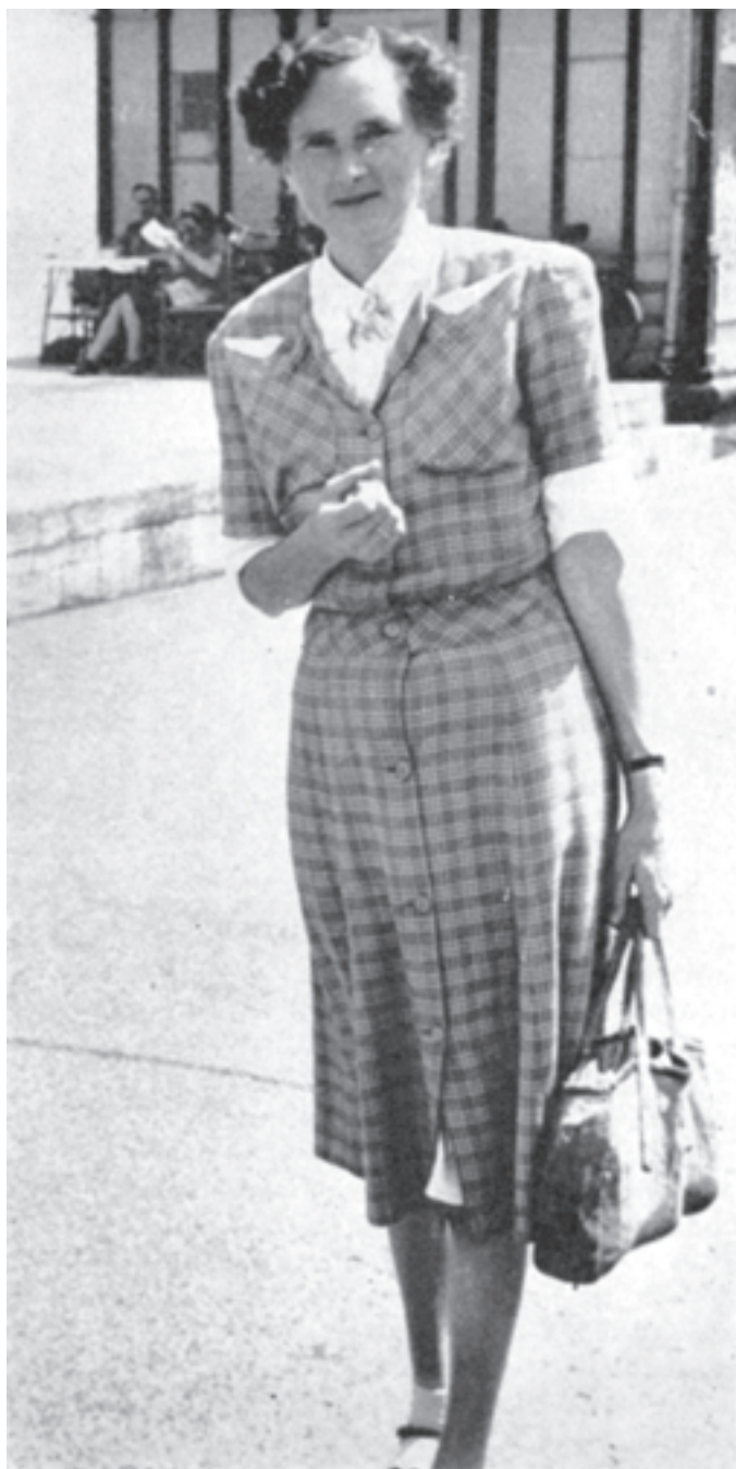
Questa foto accompagnò la sua testimonianza di guarigione.