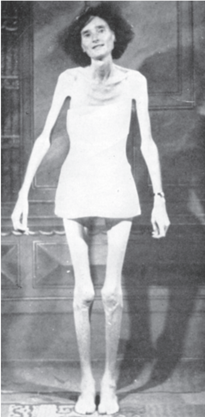
Questa è una copia della foto che accompagnò la richiesta di preghiera di Florence Nightingale.