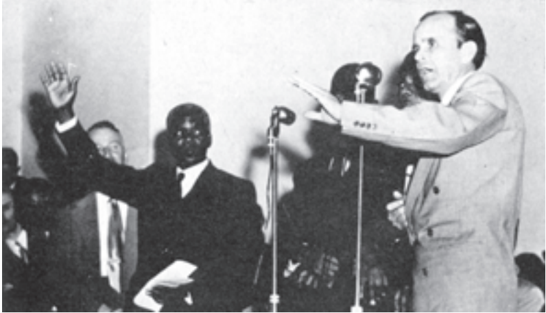
Il Fratello Branham che ministra agli indigeni con tre traduttori.