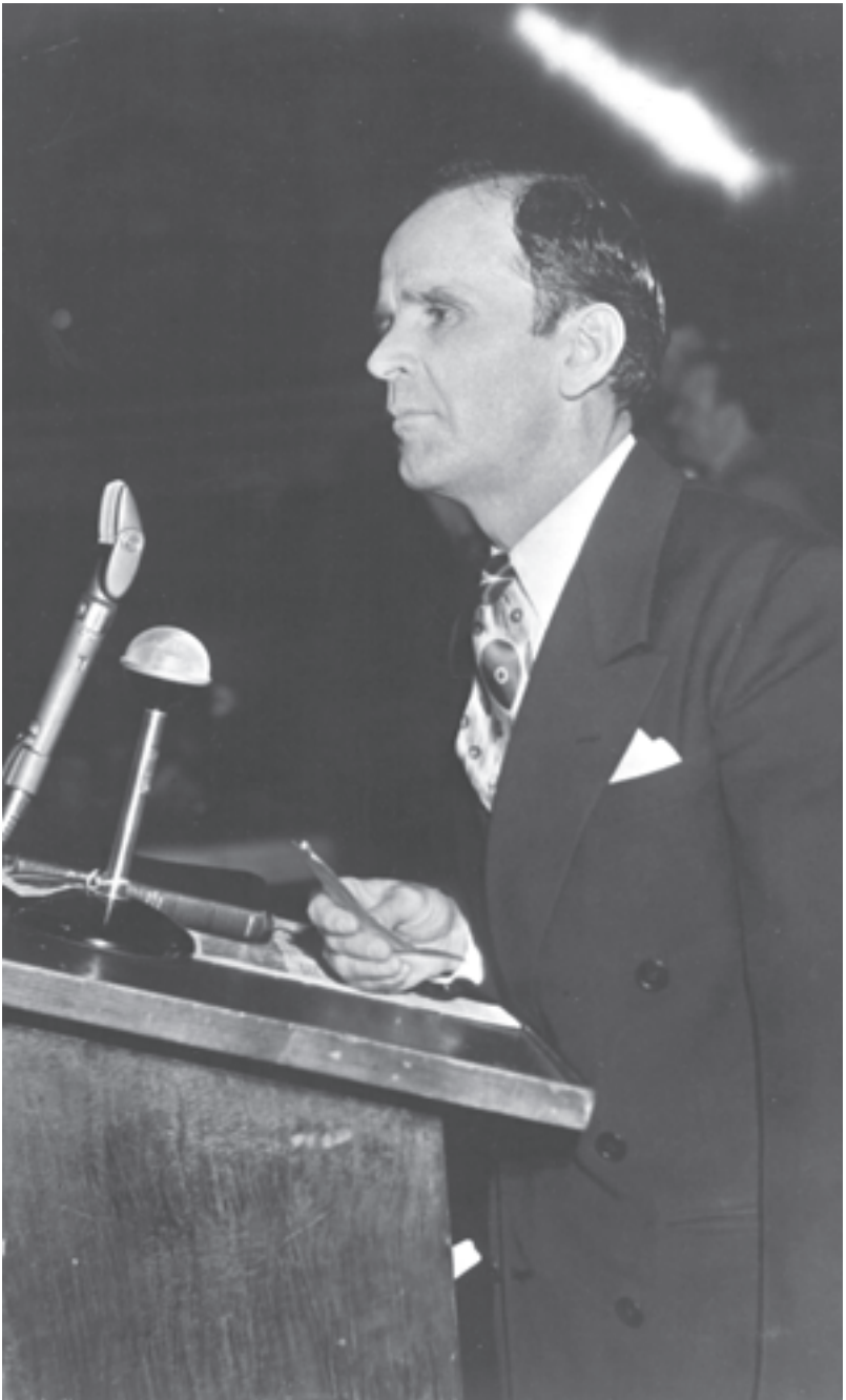
William Marrion Branham