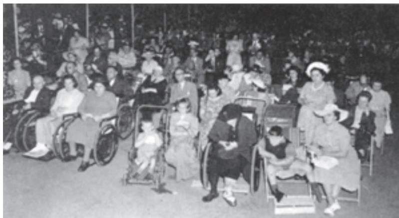
Una piccolissima parte della folla al servizio di sabato sera.