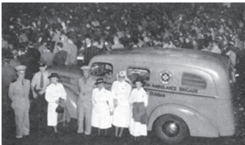
Alcuni dei membri del Corpo Ambulanze St. John che offrirono volontariamente i loro servizi.