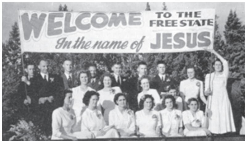
Il coro del Comitato di Benvenuto che ci venne incontro alla periferia della città.

cantava: “Sol Abbi Fe”. Il Fratello Bosworth disse alle persone che avrebbero visto qualcosa che nessuna persona aveva visto dal tempo in cui Cristo fu sulla terra. Mai prima nella storia della chiesa Dio è venuto ad operare in questo modo. Com'era vero questo poiché Dio operò nella città di Bloemfontein come non aveva mai fatto prima. Migliaia di persone erano venute da molte miglia. Intervistai un uomo che era venuto in aereo dal Nord Africa, approssimativamente quattromila miglia. Mi fu detto da un agente di polizia che stimavano che erano a Bloemfontein più di mille macchine da fuori città. Di nuovo non ci fu nessun auditorio grande abbastanza da contenere le folle previste. Il comitato locale aveva preso accordi per usare la Fiera, che aveva circa 6.000 posti a sedere. Quella primissima sera le aree furono piene di migliaia sedute su sedie e banchi il più vicino possibile al palco.