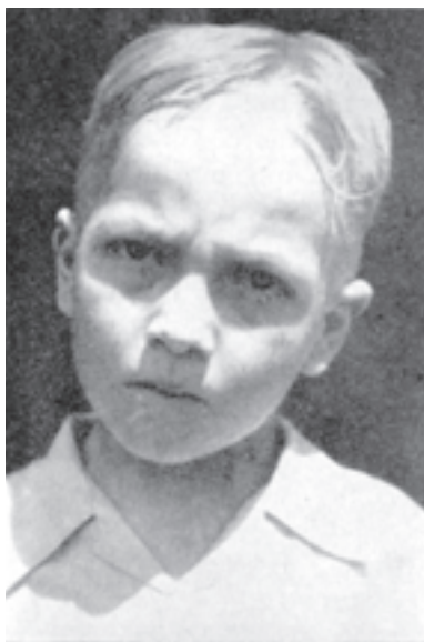
Una volta i suoi occhi erano strabici, ora sono normali.