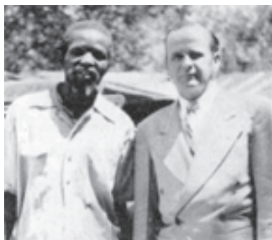
Il Fratello Branham con un pastore indigeno.

Poi ieri sera abbiamo avuto una grande battaglia in casa. A mamma, che vi conobbe nei primi giorni di Zion, è comparso il tetano in modo certo. Con le sue mascelle fermamente bloccate abbiamo pregato fino a che lei stessa è stata in grado di pregare