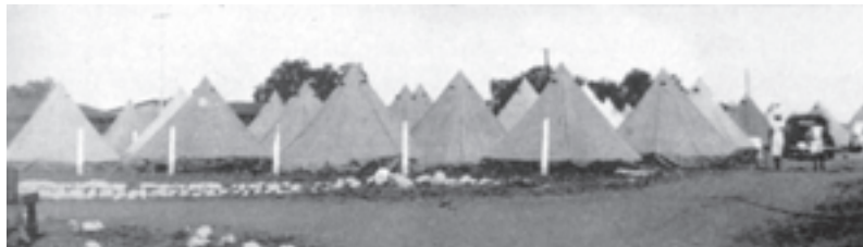
Un piccolo gruppo delle tende che erano state erette per accogliere un po' delle persone di fuori città che erano venute per le riunioni.

Il Fratello Bosworth portò messaggi sulla guarigione Divina. Poiché a migliaia si radunavano lì alla Fiera prima delle sei, molto spesso i servizi cominciarono a quell'ora. Egli