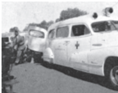
Scene come questa erano usuali e spesso le ambulanze ritornavano vuote.

Benché la maggior parte delle riunioni fossero tenute per gli europei, tuttavia erano stati predisposti tre servizi per gli indigeni. Occasionalmente fummo in grado di far entrare nel già affollato programma alcune riunioni extra per gli indigeni. Sabato pomeriggio il Fratello Bosworth parlò ad uno di questi servizi. Dopo il suo messaggio chiamò sul palco circa una dozzina di persone che avevano avuto operazioni di mastoide radicale. A queste persone era stato rimosso un timpano. Allo scopo di farli udire attraverso quell'orecchio,