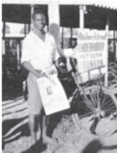
Un giornale Afrikaan presenta un'intervista con il Fratello Branham.

essere il tuo Salvatore e Signore. Se Lo accetterai come tuo Salvatore, il Messia, Egli sarà anche il tuo Guaritore. Se lo fai, alza la mano". Ella alzò la mano e immediatamente fu in grado di vedere. Mentre eravamo all'aeroporto il mattino seguente in procinto di partire per gli Stati Uniti, un uomo venne e raccontò che lei poteva allora vedere perfettamente ed era fuori che visitava i suoi amici che non aveva visto per anni.