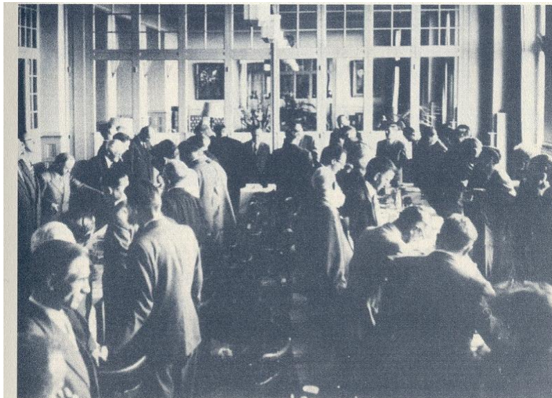
Fotografia 1 Losanna Svizzera

La prima fotografia sembrava normale. Mostrava i quaranta ministri che pregavano di fronte alle loro tavole. Lo staff dell'hotel aveva collegato queste tavole in un modello di forma rettangolare con le due linee di tavole più lunghe che andavano da nord a sud. I ministri erano su entrambi i lati dei loro tavoli posti uno di fronte all'altro, con la testa piegata. La fotocamera era stata fissata sulla cima di un alto treppiede centrata all'estremità sud della sala. Dato che Bill si trovava di fronte alla fotocamera al centro del tavolo, a nord della fotocamera, l'immagine catturò una chiara, anche se distante, vista della sua testa. Dietro di lui c'era un'intera parete di vetrate e porte in vetro che si affacciavano sulla hall. Le finestre verso l'esterno si trovavano sul lato destro della fotografia, così il sole del mattino illuminava il lato a est di tutto nella stanza, mentre metteva in ombra tutto dalla parte ovest.