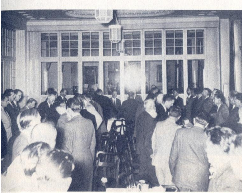
Fotografia 3 Losanna Svizzera

La terza immagine mostra la palla di luce che circonda la testa di Bill, che lo toglie completamente dalla vista.