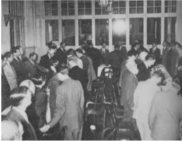
Fotografia2 Losanna Svizzera